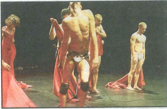
■ Out of Context: 'Wie zich kan openstellen, maakt iets mee. Iets dat ver gaat.'

"Toen Out of Context in Turnhout te gast was, zat ik achter een groepje mensen die beroepshalve met theater bezig zijn. Ze gingen zo'n beetje in hun zetels hangen, en ik hoorde er eenje zeggen: 'Maak mij wakker als er iets gebeurt hé'. Het duurde geen vijf minuten of ze zaten allemaal op het puntje van hun stoel, en bij het applaus waren zij de eersten die recht veerden. Er is iets met Out of Context dat niet rationeel te verklaren valt, maar wie zich kan openstellen maakt iets mee, iets dat ver gaat. Heel veel mensen beginnen te wenen, tijdens of na de voorstelling. Iemand heeft mij gemaild: 'Het was zo puur, zo ontgaan van alles, dat ik wou dat ik langzaam kon doodgaan'. Van zo'n reactie ben je wel even ondersteeboven."