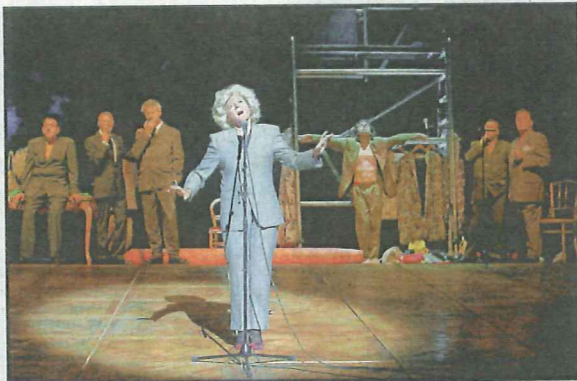
■ Gardenia: 'Zelfs de mooiste mensen hebben zelden totaal vrede met zichzelf.'

"Het interesseert me enorm allemaal. Met Out of Context zijn we in Zagreb geweest, de hoofdstad van Kroatië. Als je voelt hoe groot de impact daar nog altijd is van dat ene jaar dat de bewoners de oorlog intens hebben meegemaakt, inmiddels negentien jaar geleden, da's onwaarschijnlijk. Ik heb ook al in Kinshasa gezeten, en we gaan al tien jaar naar de bezette